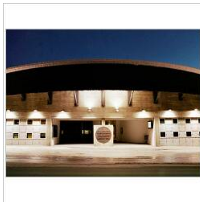
Schwerpunkt – Erweiterung Kongresszentrum

den Wettbewerb Kongresszentrumserweiterung. Hier bin ich sehr froh, dass der Grosse Landrat mit dem zwei Millionen Planungskredit ein deutliches Zeichen gesetzt hat. Das Interesse in Architektenkreisen ist gross. Über 70 Architekten aus dem In- und Ausland haben sich für das Projekt gemeldet. Für den Wettbewerb haben wir uns nun für 15 Büros entschieden. Im Juni können wir über das Siegerprojekt entscheiden. Ich bin sehr gespannt auf die Projekte.