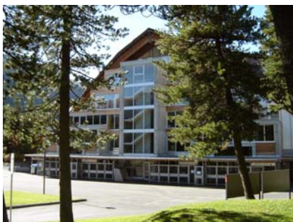
Schwerpunkt – Vaillant Arena

C. Deragisch: Hier standen sicher die raumplanerischen Vorbereitungen der Zweitwohnungsvorlage im Vordergrund, welche sehr viel Zeit in Anspruch nahmen. Eine Knacknuss war die Sanierung Südtribüne der Vaillant Arena. Die Bedürfnisabklärung zeigte sehr schnell, dass mit den vorhandenen Geldmitteln die gewünschten Verbesserungen nicht erzielt werden können. Bei den Abklärungen standen die Instandstellung der wichtigsten baulichen Massnahmen, eine Verbesserung der wirtschaftlichen Situation des HCD sowie die Einhaltung des finanziellen Rahmens im Vordergrund. Hier haben wir nun eine Lösung gefunden und arbeiten an einem Bauprojekt, welches Ende Jahr dem Volk zur Abstimmung vorgelegt werden soll.