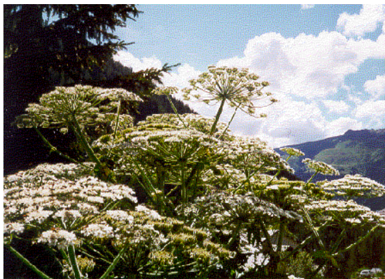
Riesen-Bärenklau im Dischma: Dolden in Fruchtbildung

Der Riesen-Bärenklau (Umgangssprache: Riesen-Kerbel) erreicht eine Höhe von 2–3 m. Der Blütenstängel kann bis 10 cm dick werden und ist oft rot gesprenkelt. Seine weissblühenden Dolden können einen Durchmesser von bis 50 cm erreichen. Die Blätter sind 3-zählig zerschnitten und unterseits kurz behaart. Die Blütezeit dauert in Davos von Juli bis August.